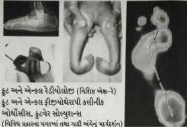
ફુટ અને એન્કલ રેડીયોલોજી (વિશિષ્ટ એક્સ-રે) ફુટ અને એન્કલ ફીજીઓથેરાપી કલિનીક ઓર્થોડીસ્ટ, ફુટવેર સોલ્યુશન્સ (વિવિધ પ્રકારના પગરખાં તથા ગાદી અંગેનું માર્ગદર્શન)

ફુટ કલાસરૂમ એક એવો આગવો અભિગમ છે કે જેમાં સામુહિક અર્થાં, વિચારવિનિમય, માર્ગદર્શન દ્વારા પગના પંજ તથા ઘૂંટીનાં પ્રશ્નોનું વૈજ્ઞાનિક જ્ઞાન આપવામાં આવે છે. ફુટ સ્કુલ પગનાં પગરખા કેવા હોવા જોઈએ તેનાં વિશે પણ માહિતી આપે છે.